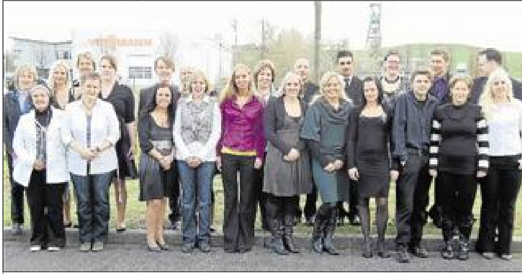
Alle Teilnehmer des Fachseminars für Altenpflege haben direkt im Anschluss einen Arbeitsplatz gefunden.

Diese, so Sigger, werde sich 2010 voraussichtlich nicht so stark auf dem Arbeitsmarkt niederschlagen, wie in manchen Szenarien befürchtet. < mf