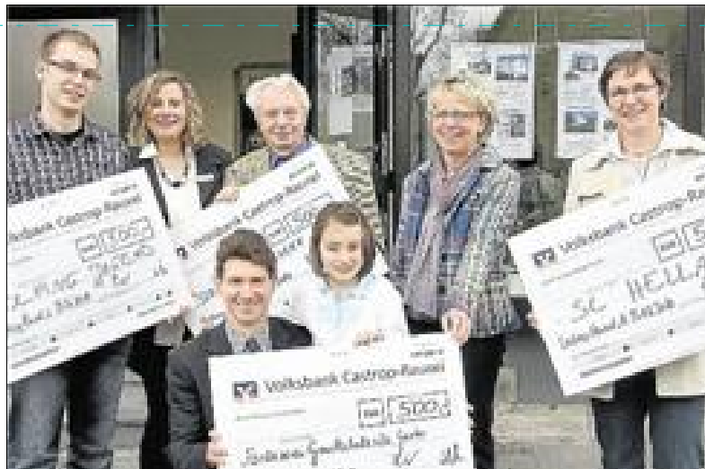
Die Vertreter der Institutionen und Vereine freuten sich über die Spenden.

„Als regionale Bank wollen wir die Institutionen, die sich vorbildhaft zum Wohle aller engagieren, im Rahmen unserer Möglichkeiten in ihrer Arbeit unterstützen.“